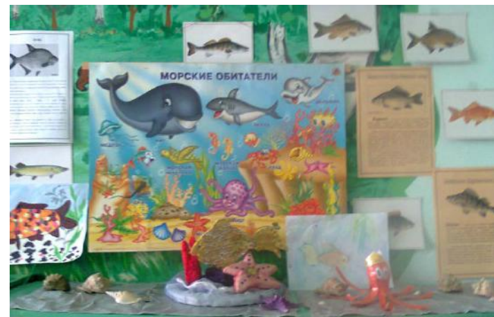
Творческая выставка Подводный мир»