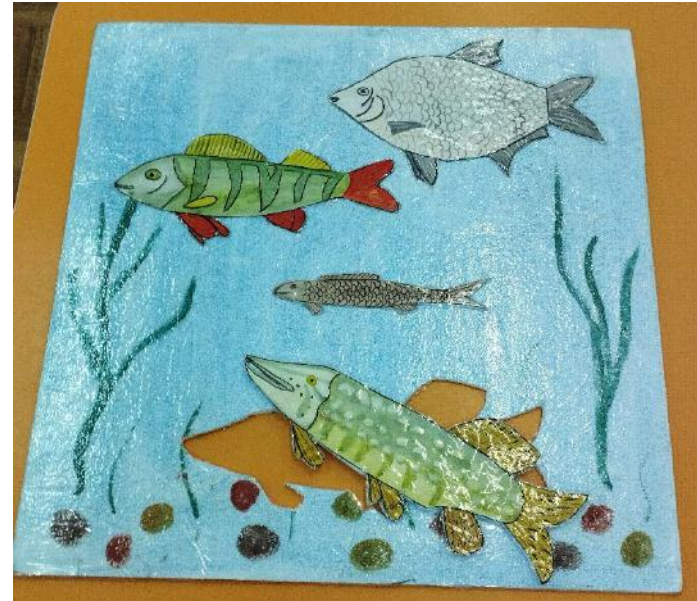
Пазлы «Речные рыбы»