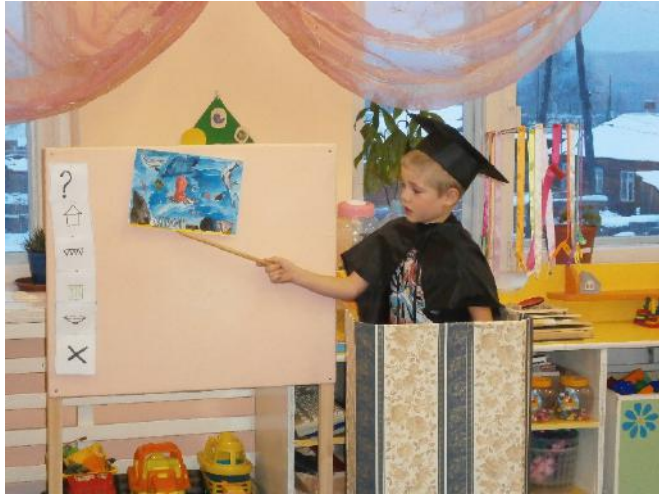
Защита мини проекта «Осьминог»