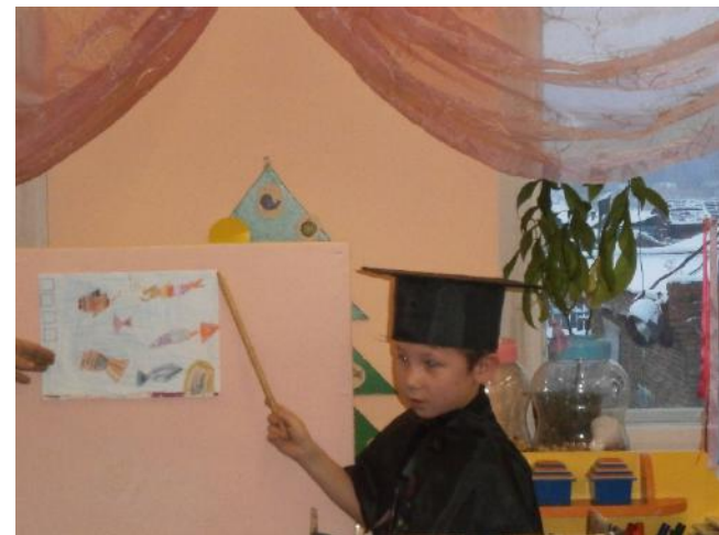
Мини проект «Глубоководные рыбы»