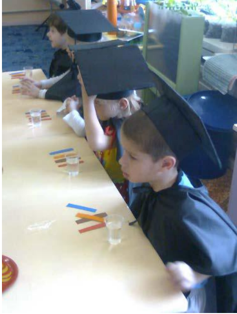
Познавательные опыты с водой