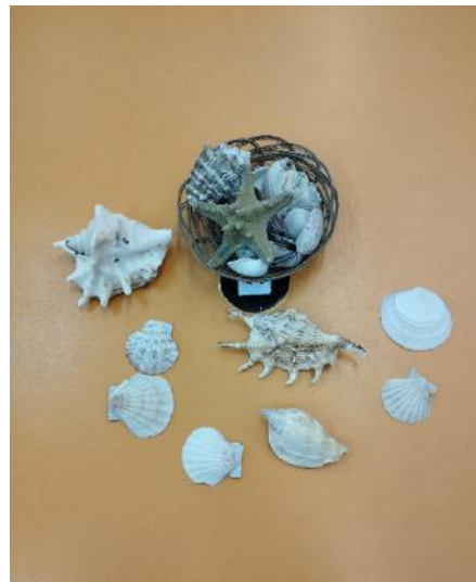
Коллекция «Сокровища чёрного моря»