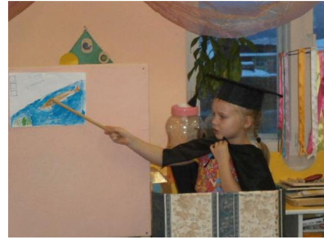
Мини проект «Щука»