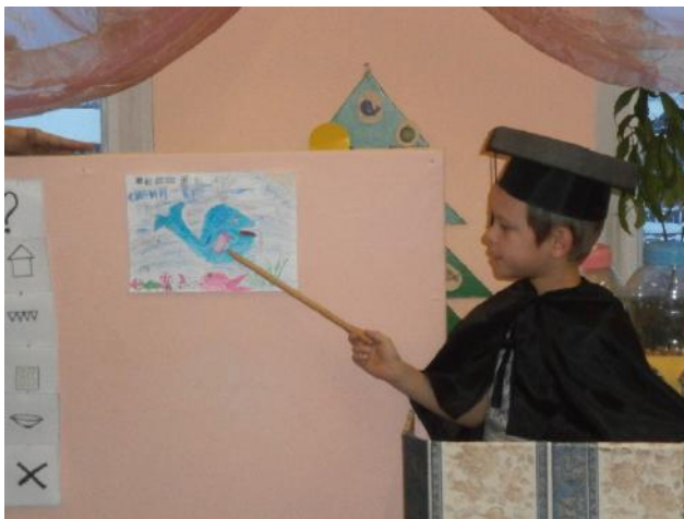
Мини проект «Синий Кит»